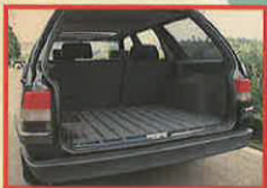
長いバカンスもOK!のスクエアで使いやすいラゲッジスペース