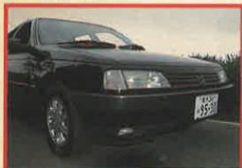
ビニンフェリーナデザインの大好きなフロントノーズ!