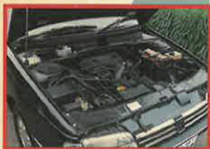
2700prmで最大トルクを発揮する実用的エンジン