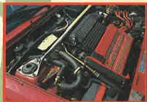
赤いカムカバーが気分 dockanターボのエンジン!