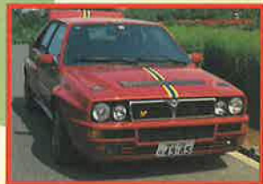
25mmローダウンされたボルドーレッドのボディ。黄色と青のストライプがコレツィオーネの証だ! ※コレツィオーネは日本向け特別仕様として250台限定生産された。