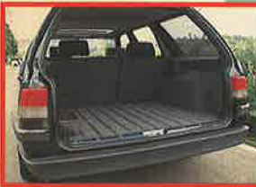
長いバカンスもOK!のスクエアで使いやすいラゲッジスペース

CG：インプレッションをお願いします! KT：夏はキャンプ、冬はスキー、スノーボードと家族全員のトランスポートとして利用していますが、とにかくこの手ごろなサイズとパッケージングは重宝します。特にラゲッジスペースはフラットでタイヤハウスの巧みな処理により使いやすい。実家が大阪で帰省した時も、後ろが見えなくなるくらい荷物を山盛り積んでも高速の安定性は変わるどころか、むしろ良くなったぐらいです。シートも適度に柔らかく、往復1,000kmのロングドライブでも平気です。エンジンもスペックは控え目だけど、低速トルクは必要充分、高速もパワーがあり過ぎて挑発されることなくリラックスさせてくれるタイプです。トラブルもなく現在快調、唯一気になるのは4000kmで700cc消費したエンジンオイルの量ぐらいですネ。