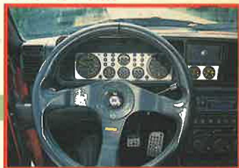
マシンのコンディションを伝える見やすくファンなインパネ、ソノスタータースイッチ!