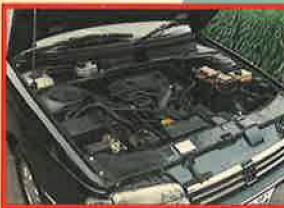
2700prmで最大トルクを発揮する実用的エンジン