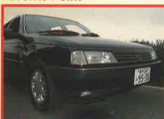
ビンファミリーデザインの大好きなフロントノーズ!