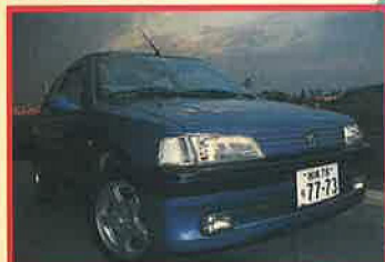
何度見ても飽きない、大好きなフロントマスク