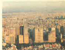
■夕焼けで赤く染まる、新宿の摩天楼群

FCGのメンバーの方にはもうお馴染み、年に4回開催している定例飛び会!毎回全国から20名余りの熱烈な大空の愛好家が集うホッとでライブなイベントです。メインはもちろんフライトとBBQ(バーベキュー)!参加者は初参加の見学者から常連のベテランまで、年齢も学生から年配の方までバラエティに富み、フレンドリーな雰囲気があります。目の前ではクラブ機R-44が離着陸を繰り返しています。フライトの感想をみんなで話し合ったり、即席評論家として熱弁ふるったり、イベント会場では賑やかな会話と笑いでBBQの箸もすむことうけあいです。そのアナタ、コタツに丸くなっていないで、この空気のクリアーな寒い冬こそ、大空にチャレンジするGoodな季節ですよ!皆さんの積極的な参加をスタッフ一同お待ちしております。