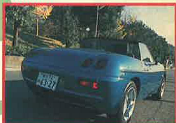
キュートでグラマラスなリヤビュー