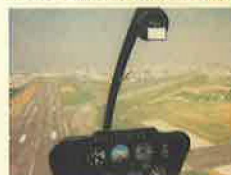
■給油に立ち寄った八尾飛行場(大阪)、アプローチ中のショット