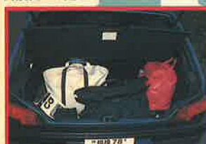
必要充分の容量が確保されているトランク