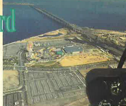
■大阪りんくう航空ショー会場。後方の島に見えるのは関西新空港

今回は昨年の活動を振り返り、東へ西へ大活躍したR-44の軌跡を写真とキャプションで綴ります。それにしても、いやアあっちこっち飛びました。イベント参加のため大阪に行き、台風巻き込まれ避難したり、鳥羽では沈没したクルーザーの引上げ作業の現場に出くわしたり、山形に向かう途中、悪天候で福島から引き返したりいろんなドラマがありました。今年も、もちろん精力的に活動します。特にサーキットの空撮にチャレンジし皆さんにご紹介しますのでご期待ください!