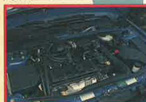
軽快に回る1587cc直4OHCエンジン