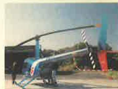
■飛行前点検中のR-44とパイロット(ショット真剣です。)