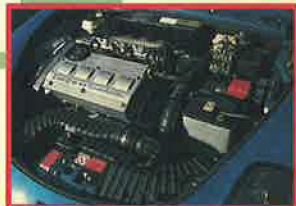
官能的な1746cc直4DOHCエンジン