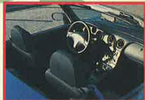
甘い香りがする適度にタイトなコクピット