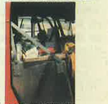
就任直前には、補助タンクが(計8時間飛行可能)