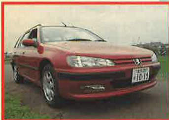
“プジョーらしさ”が溢れるスタァリング