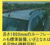
長さ1800mmのルーフレールも標準装備。いざとなれば長尺物も積載可能!