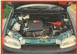
活発なエンジン、メンテナンスしやすいエンジンルーム