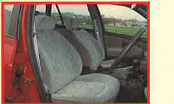
カラダとハートを優しく包んでくれる、ソフトなシート