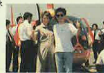
新コンビ結成!ジェニファーとカーツ!