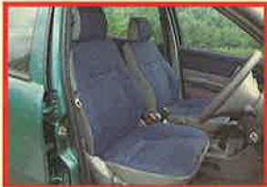
疲れ知らずの快適なシート