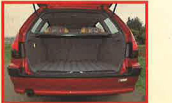
使いやすいフラットでスクエアなラゲッジルーム