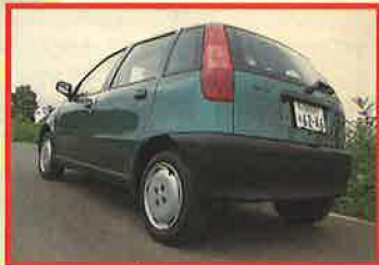
遠くからでもすぐプントだと分かる、キュートなりアビュー