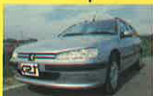
ブジョーのアイデンティティが表現されている端正なマスク

ウェッジの効いたピニンファリーナによるスタイリングはエレガント! 405ブレイクに比べ、全長が320mm、全幅で50mm拡大されたボディは、アッパーミドルクラスのワゴンとして、充分なスペースを稼いでいる。また、ブレイク専用設計されたリア部にはルーフ、ルーフクロスメンバーにより、セダン同等の高いボディ剛性を実現している。