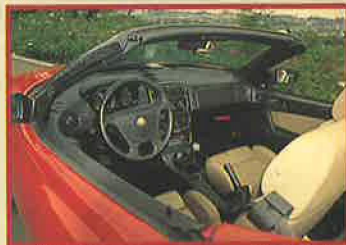
個性的なインテリアとシックなタン革のシート。