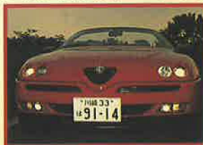
伝統と独創性の融合、大好きなフロントマスク。