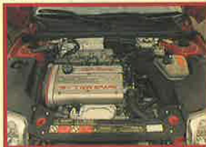
アルファミュージックを歌うツインスパークエンジン。