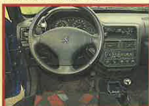
長距離でも快適なシートと操作性の良いcockpit。