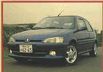
サイズを超えた実用性と存在感のあるデザイン。