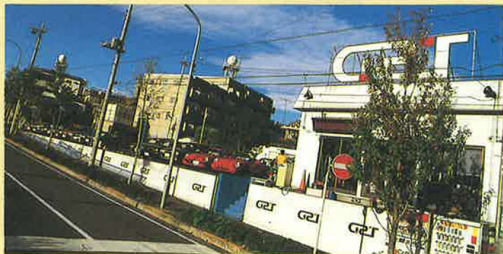
横浜店 神奈川県横浜市緑区美しが丘5-30-1

ワークスが1台1台、手塩にかけ、120項目にもわたるチェックを施し、新たな命を吹き込んだクルマ……Blood New Car。ジーエスティーが情熱をかけて創造り上げたクルマ達を是非、各ショップで実感してください。