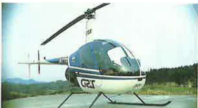
美人の試乗でいつもより心なしか調子の良かった？ R-22マリーナ

皆さんお元気ですか？フライト以外では地に足付けて生業に勤しむ航空事業部です。食欲の春、スポーツの春、フライトの春、ということで今回は去る3月12日に行われた、昨年のフレンチブルーミーティング時の体験フライト当選者の方によるインプレッションを送ります。